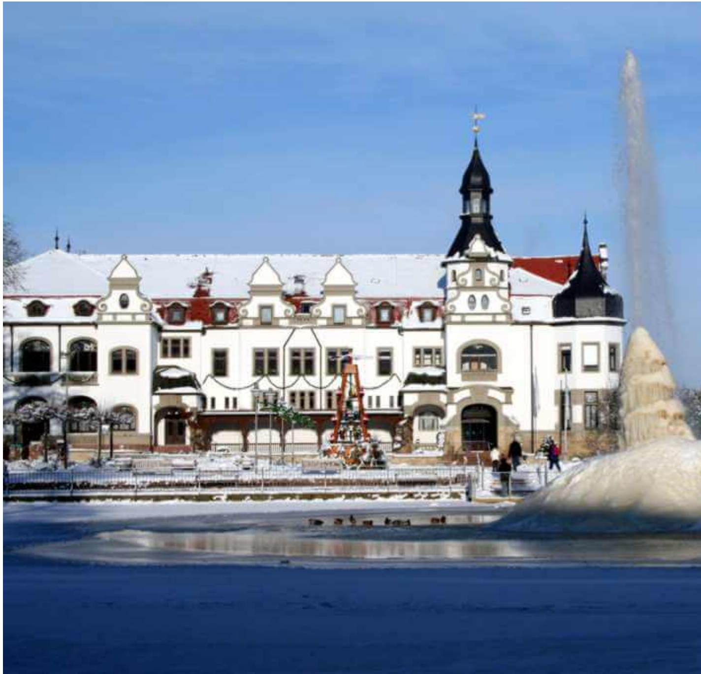
Kurhaus und Schwanenteich