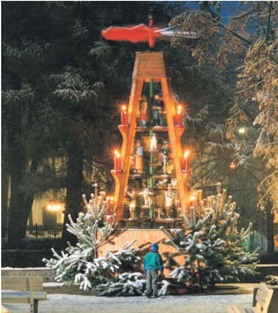
Weihnachtspyramide auf der Kurpromenade