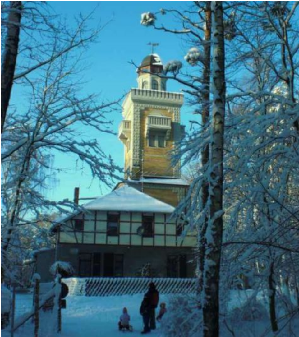
Aussichtsturm "Schöne Aussicht"